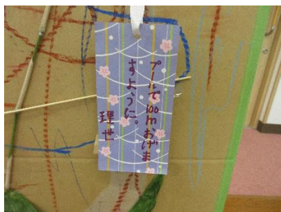
「プールで100m およげますように」