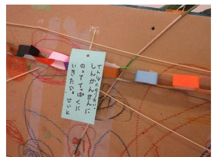
「てっぴくにいきたい」