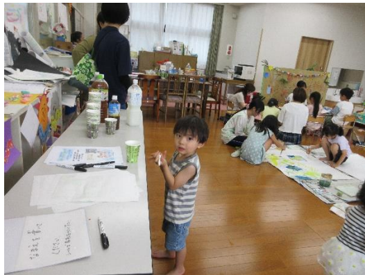
小さい人たちも、自分であそびたいこと、やりたいことを見つけます