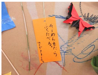
「そうめんをたらふくたべる」