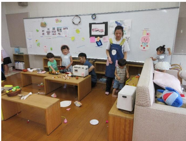
おとうさんもままごとに入る