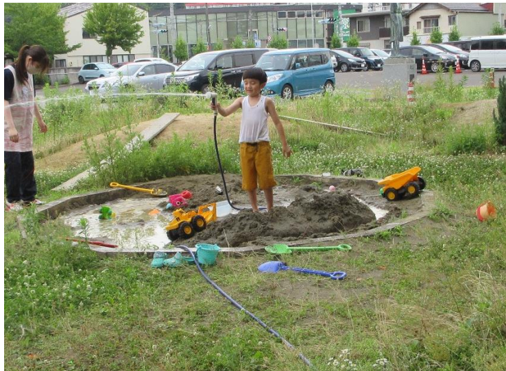
水を出していれば、暑さは感じないわけで、そのうち泥水で「泥水鉄砲」で学生も泥だらけに。