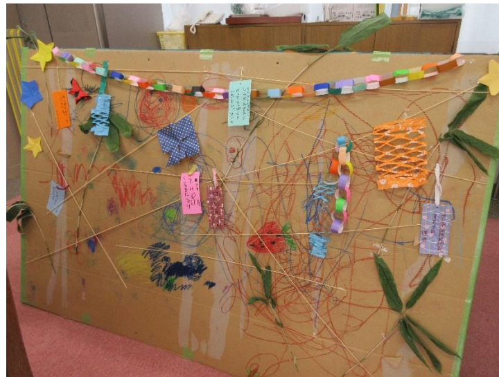
学生達との合作です

今日も11組38名の親子の皆さんと保育コース1年生5名が入ったにぎやかな広場でした。お手伝いは1年生の学生だけでしたが、おかげさまで動きもよくなって、頼もしくなってきました。