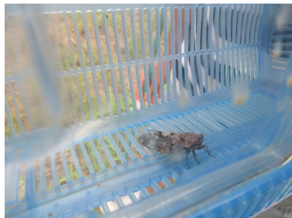
ニーニーゼミ・・・お見事！