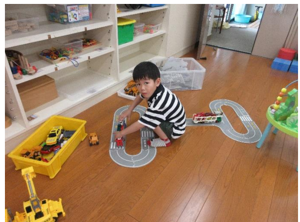
ミニカーを独り占め