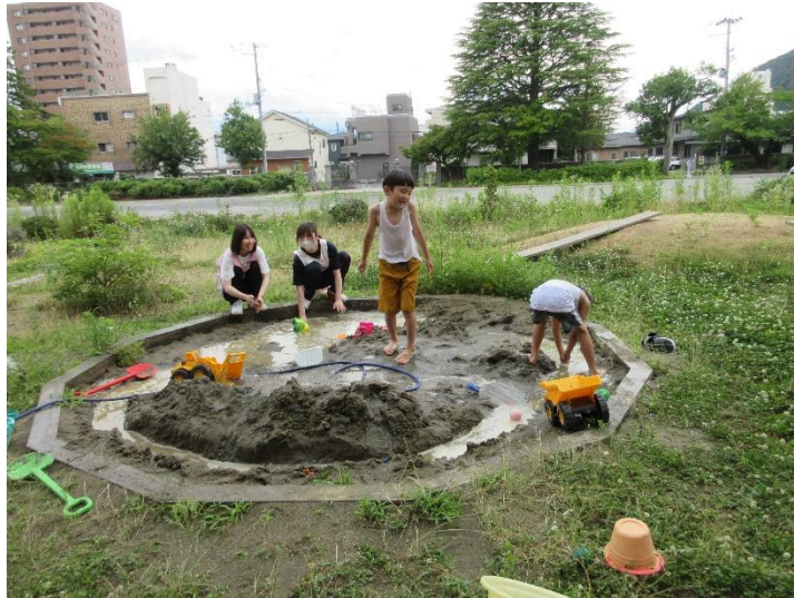
こちら、砂場は、沼のようになりました。時々、「島」を作ったりしていたそうです。