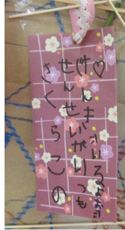
「さくらっこの先生がいつもげんきでいるように」