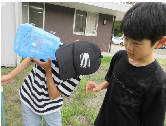
とれましたよ・・・